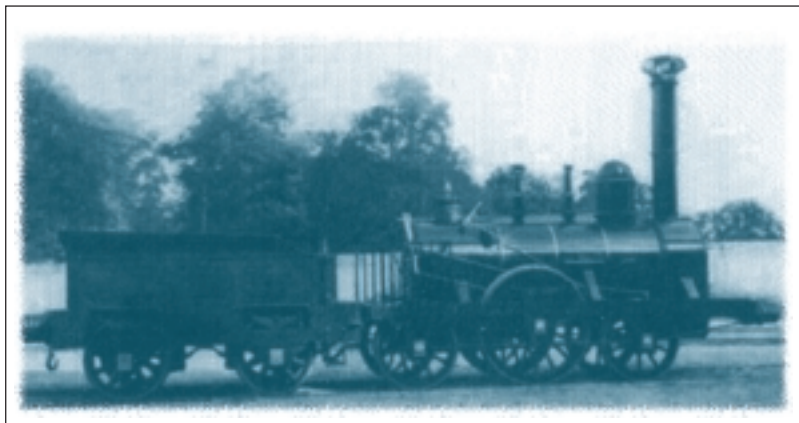
Fig.1. La première locomotive à vapeur

Dès 1835, la première locomotive à vapeur circule sur le continent européen. Elle relie Bruxelles à Malines. Son constructeur : John Cockerill. L'avènement de la révolution industrielle et les performances remarquables de cette locomotive inciteront John Cockerill à devenir précurseur en matériel de chemin de fer. Au fil des ans, de nouveaux modèles, vendus à des milliers d'exemplaires, quitteront les ateliers Cockerill vers le monde entier. Sollicité ensuite par Rudolf Diesel, les premiers moteurs Diesel sont également fabriqués dans les ateliers de John Cockerill et fournis à des clients du monde entier. Par la suite, les usines John Cockerill évoluent vers la construction de leur propre moteur Diesel. Aujourd'hui, cette activité se perpétue au sein du Groupe CMI, à travers son unité CMI Locomotives, spécialisée dans la conception, la fabrication et la maintenance de locomotives de manœuvre à transmission hydrostatique. CMI Locomotives est également un fournisseur réputé pour son offre complète de services (modernisation, pièces de rechange, ...) en locomotives de manœuvre de toutes marques.