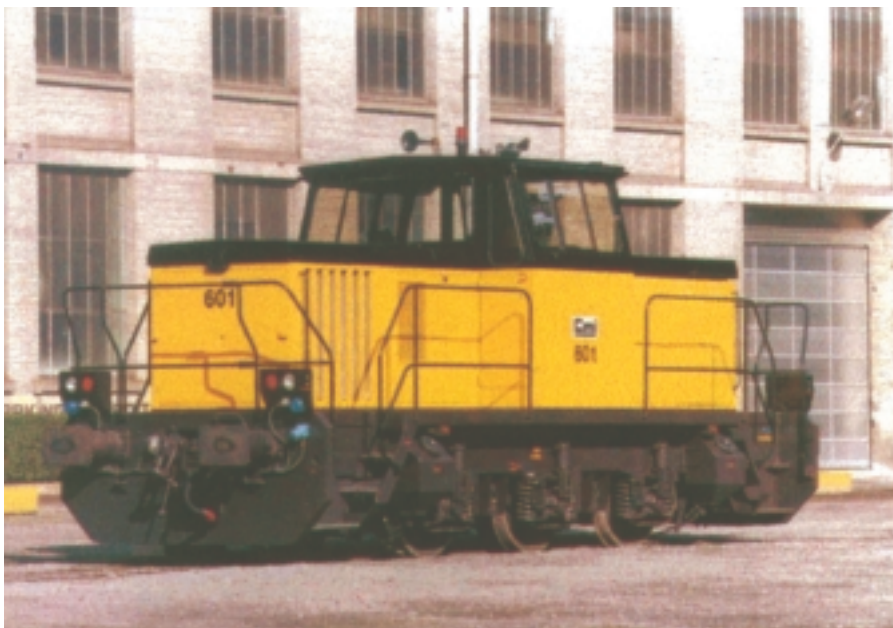
Fig.2. Locomotive de manoeuvre à transmission hydrostatique

nement de certaines pièces et assemblages (simulation de ressorts, mécanisme de crabotage, etc) et de vérifier les efforts dans certaines pièces. Un autre atout de SolidWorks, particulièrement apprécié par M.Coolen, est le module e-Drawing qui permet de créer, de visualiser, d'envoyer et de recevoir des mises en plan de projets par courrier électronique sans que le receveur ne possède de licence SolidWorks. Un client qui reçoit un plan de ce type peut ainsi contrôler dynamiquement les cotes, visualiser le modèle en mode ombragé et même l'animer. Tout cela apporte un gain de temps important au niveau des échanges avec les clients, ajoute encore M.Coolen.