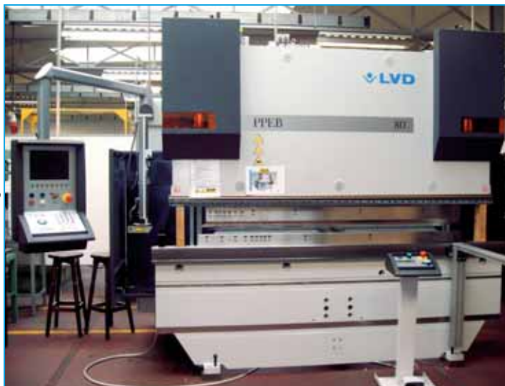
PG/Technisch Instituut Sint-Jansberg

Via les contacts en provenance du comité directeur, des demandes arrivent parfois pour la fabrication de pièces spécifiques. Celles-ci sont alors insérées dans le programme d'exercices pratiques –